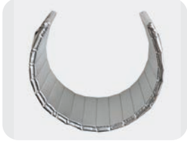
开槽及铝箔袋抽真空

根据客户实际应用需求，可定制不同弯曲曲率的产品，也可提供多片组合的产品方式对大型管道或设备进行保温。此选项的材料厚度及开槽厚度可根据需求定制。